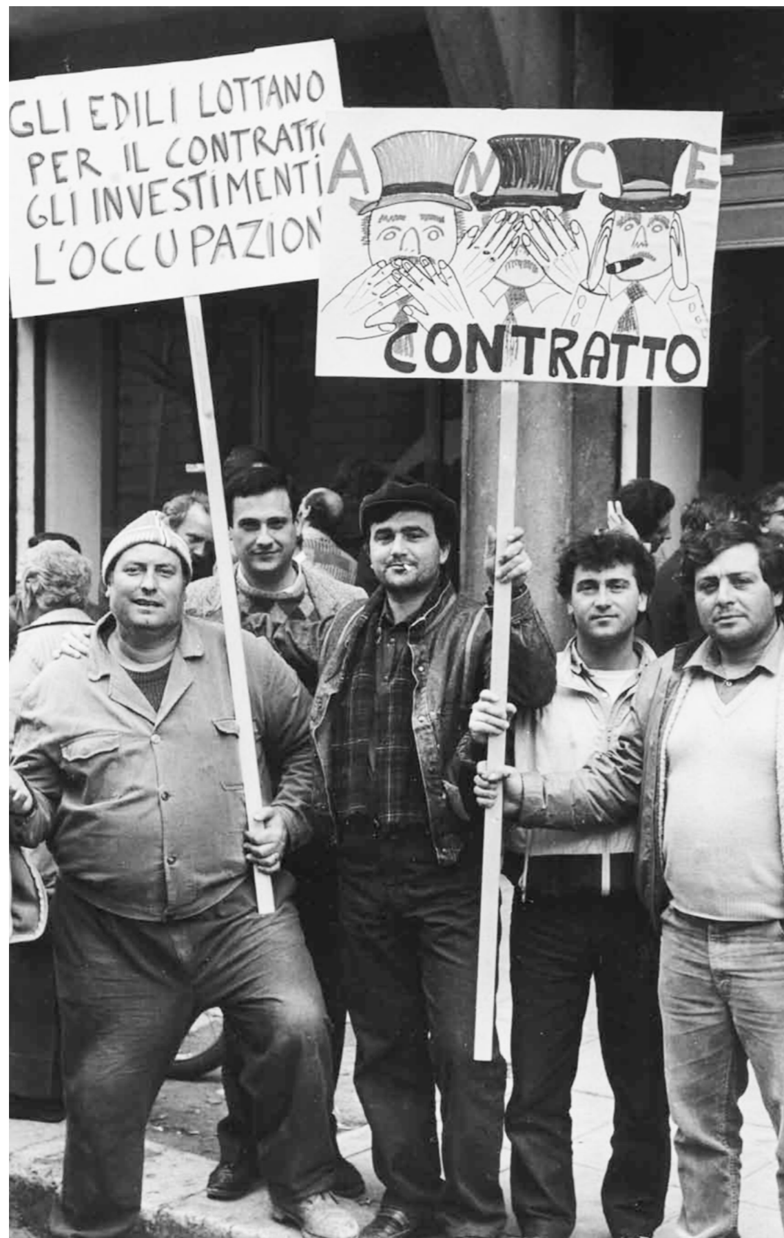
Milano 28-29-30 Novembre 2019

divenne uno degli ambiti del confronto tra le parti sociali a livello contrattuale. Negli anni successivi, di fronte a una situazione generale stabile, con il Paese interamente impegnato alla ricostruzione e a fronte di una situazione economica nel segno di una costante e progressiva crescita, sul fronte contrattuale non vi furono particolari novità se non l'aggiornamento dei minimi salariali con un aumento del 4% per i manovali e del 5% per gli operai nel 1953. Il tema del finanziamento delle Casse Edili venne affrontato nel 1959 quando, con il contratto di categoria, fu affidato alle associazioni territoriali il compito di determinare l'ammontare del contributo paritetico da parte degli imprenditori e dei lavoratori entro un massimale stabilito a livello nazionale. A quell'epoca le casse territoriali erano 20 destinate a diventare 42 nel 1961.